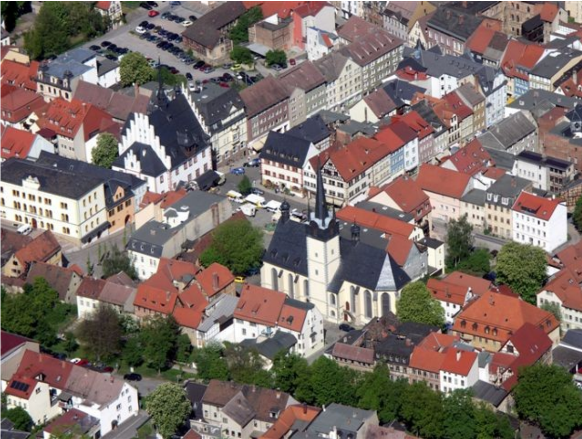
Historische Altstadt von Pößneck.

Wollte man die Stadt an der Kotschau auf eine Kurzformel bringen, wäre diese also naheliegend: Stadt des Buchdrucks im Herzen Thüringens, mit rund 13.000 Einwohnern, über 100 Vereinen und dem ältesten Hallenbad des Landes, in herrlicher Lage und mit schöner Stadtanlage, mit gesunder Wirtschaftsstruktur und nahe zu den zentralen Autobahnen Deutschlands.