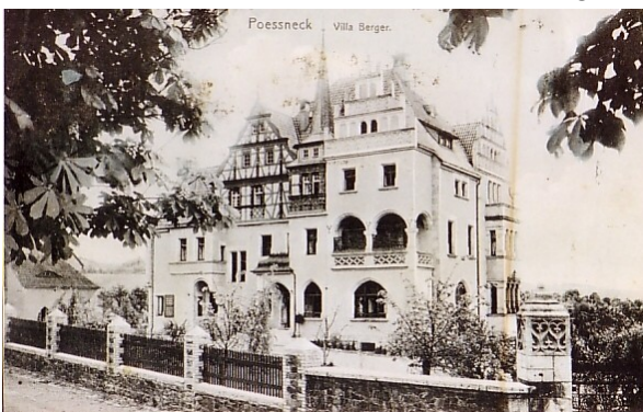
Villa des Schokoladenfabrikanten Berger.

In diesem Umfeld gediehen auch bürgerliche Lebensart und Vereinsleben, Kunst und Architektur. 1844 wurde hier Robert Diez geboren, der als erfolgreicher Bildhauer später in Dresden Ernst Barlach unterrichtete. Er schuf den Gänsedieb-Brunnen, der als Kopie noch heute in der Pößnecker Bahnhofstraße steht. Das viel beachtete Original entstand für Dresden und brachte Diez 1878 die Große Goldene Medaille der Internationalen Kunstausstellung in München ein. Auch das Grabmal der Familie Berger auf dem Pößnecker Friedhof stammt aus Diez' Werkstatt. Ein anderer berühmter Pößnecker erblickte 1876 unweit des Marktplatzes das Licht der Welt. Der Maler und spätere Ehrenbürger Prof. Franz Huth. Er wirkte ab 1922 in Weimar und gilt als einer der bedeutenden Pastellmaler des 20. Jahrhunderts. Attraktive Firmenvillen aus der Gründerzeit zeugen vom damaligen Reichtum. Potente Bürger gründeten zahlreiche Stiftungen, u.a. auch das städtische Krankenhaus und das Stadtbad, das 1891 entstand und damit das älteste in Thüringen ist.