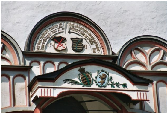
Wappen und Spruch über der Rathauptreppe.

Die hiesigen Bürger waren umsichtige und kluge Leute, die mit Fleiß und Geschäftssinn zu Wohlstand gelangten. Das ab 1487 neu errichtete Rathaus mit dem reich verzierten Staffelturm zählt heute zu den schönsten spätgotischen Rathäusern Thüringens. Die Einheimischen gaben sich früh eine Stadtordnung, die im damaligen Ausland – bei den Grafen von Schleiz und Lobenstein – ruhmvoll anerkannt und nachgeahmt wurde. Denn die Pößnecker wussten schon damals und schrieben es sich zum steten Gedenken an den Rathausgiebel: „Wo das Regiment verkehrt ist, und verborgen Neid ist, und der Gemeinnutz nicht Raum hat, diese drei zerbrechen eine feste Stadt.“