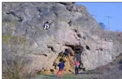
Klettern in Döbritz