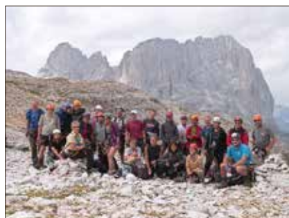
Pößnecker Klettersteig

Am 23. August 2022 begeht die Sektion Pößneck gemeinsam mit den Bergfreunden aus dem Südtiroler Grödnertal den 110. Jahrestag des Pößnecker Klettersteigs . Dieser war 1912 mit Geldern gut situiert Pößnecker Bürger an der Nordseite des Sella-Stocks errichtet worden. Die Erbauer verfolgten das Ziel, eine direkte Verbindung zwischen dem an der gleichnamigen Passstraße gelegenen Sellajoch Haus (von hier in rund 30 Minuten Gehzeit zum Einstieg des Klettersteigs) und der Bamberger Hütte (heutige Boéhütte) auf dem Sella-Plateau zu schaffen.