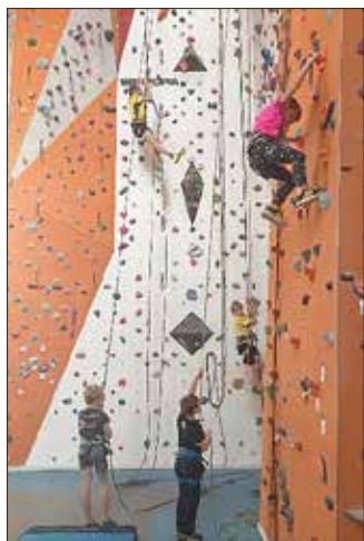
Kletterhalle Saalfeld

Mit derzeit rund 380 Mitgliedern kann sich die Sektion Pößneck des Deutschen Alpenvereins zu den größten Vereinen in Pößneck zählen. Das Einzugsgebiet der Sektion Pößneck reicht allerdings in die Regionen Saalfeld-Rudolstadt-Bad Blankenburg und Schleiz/Lobenstein. Sowohl für