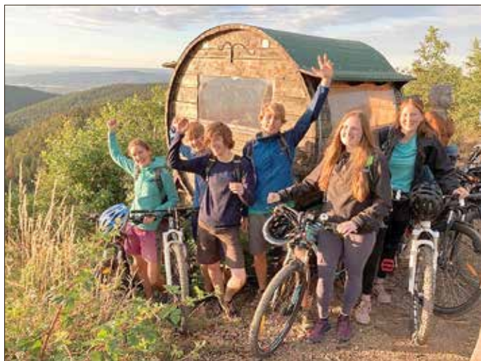
Radtour Saalfelder Höhe

Die Vereinsjugend (JDAV) handelt weitgehend eigenständig und stellt ein eigenes Jahresprogramm auf. Zu ihren Veranstaltungen gehören insbesondere das Klettern im Fitnessstudio „Life“ in Saalfeld (ganzjährig) und von April bis Oktober (mittwochs) an den Kletterfelsen in Döbritz. Zudem werden Fahrrad-/ Mountainbike-Touren sowie einzelne Bergtouren/-wanderungen und Wassersportaktivitäten durchgeführt.