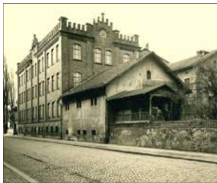
Fabrik „Conta & Böhme“

Pößneck gehörte früher zu den reichsten Städten in Thüringen. Tuch, Leder und Porzellan hatte die Stadt reich und bekannt gemacht. Viele Villen (ursprünglich gab es in Pößneck 40) erzählen noch heute von der Geschichte ihrer früheren Besitzer. Das Wort „Villa“ heißt übrigens übersetzt Einfamilienhaus.