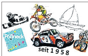
Vereinslogo des MSC Pöbneck e.V. im DMV

zu sehen sein. Hier das Team des gastgebenden MSC Pöbneck e.V. im DMV Lösche/Hofmann mit ihrem Gespann.