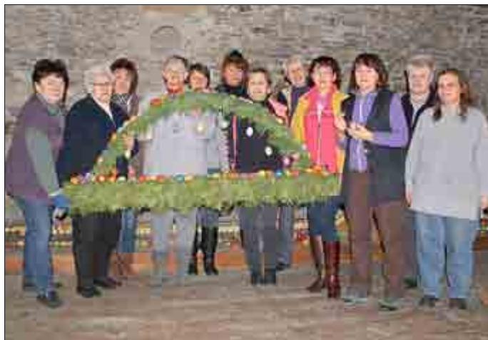
Die engagierten Osterkronen-Binderinnen/Fachbereich Kultur

Pünktlich zum Ostermarkt erhielt der Pößnecker Marktbrunnen am 22. März seine Osterkrone. Dank der fleißigen Frauen wurde die Krone in vier Tagen Arbeit von früh bis spät fertig gestellt und konnte anschließend durch zusätzliche Helfer auf dem Marktbrunnen errichtet werden.