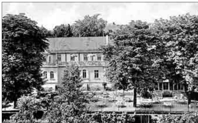
Alberts Garten um 1943

Eröffnung am Samstag, 26.05.2017, 17:00 Uhr