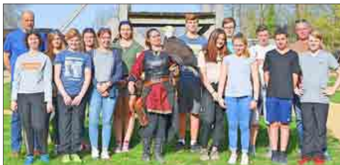
Die Falknerin mit einem Weißkopfseeadler und den Schwimmern auf der Burg von Chateau-Thierry.

Der Samstag war dann entspannter. Die Kinder besuchten den Parc des Félics - ein Wildpark im Südosten von Paris. Neben der Fahrt mit der Parkeisenbahn und einer Filmvorführung über die im Park lebenden Tiere rundete die Anwesenheit bei der Fütterung der Tiere den Besuch ab. Letzter Programmpunkt war der Besuch der Falknerei auf der Burg von Chateau-Thierry. Dort wurde den Kindern eine mittelalterliche Steinschleuder vorgeführt, ehe sie durch den Falkner extra begrüßt wurden und die Flugshow begann.