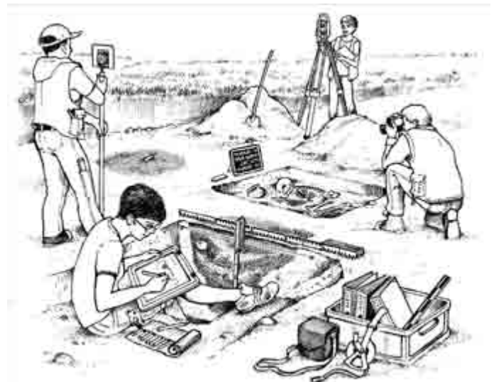
Museum642 Stationen einer Ausgrabung, Skizze Bodo Müller

Kinder können das bei einer „echten Ausgrabung“ im Museum642 erfahren.