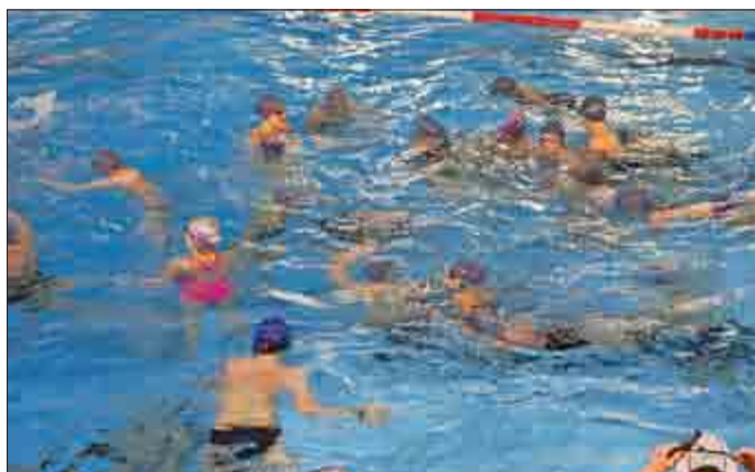
Gemeinsam probieren sich die französischen Kinder mit den Pößneckern im Unterwasser-Rugby.