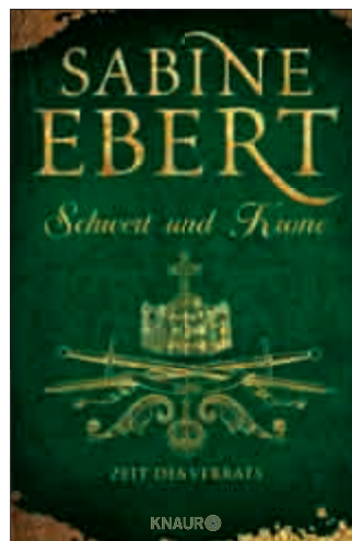
Buchcover Schwert und Krone