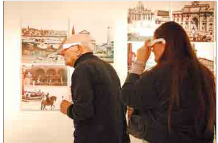
Besucher*innen schauen sich mit einer 3D-Brille die Bildtafeln der Ausstellung an.