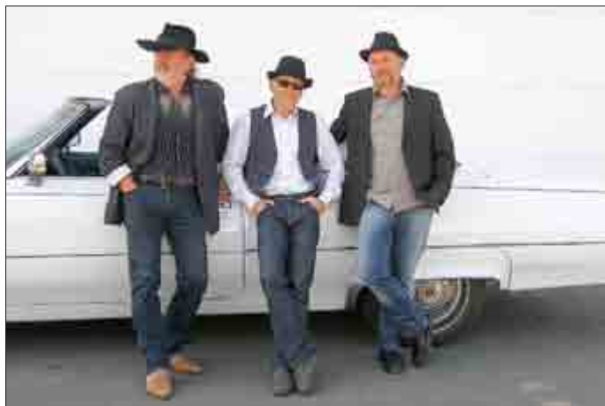
Blue Line