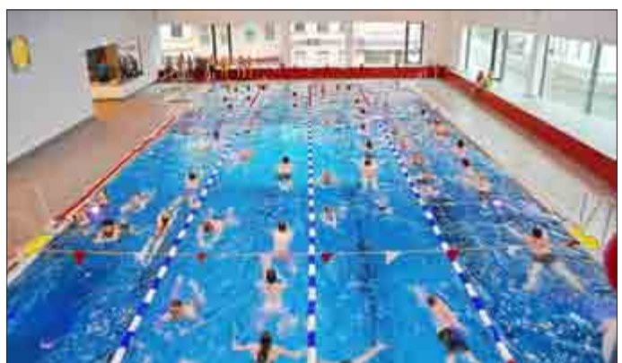
Wasserfest 2015.

Am 16. April 2016 findet wieder das Pößnecker Wasserfest der Vereine statt! Dies ist bereits die 5. Auflage des Schwimm-Wettkampfes, an dem gemeinnützige Vereine, Kindergärten, Schulen sowie andere Kinder- und Jugendeinrichtungen teilnehmen und um das Preisgeld schwimmen können. In diesem Jahr ist die Chance besonders hoch, denn der Wetteinsatz der Stadtmarketing Pößneck GmbH hat sich durch den Jackpot aus dem letzten Jahr verdoppelt. Die Stadtmarketing Pößneck GmbH wettet, dass es den Teilnehmern wieder nicht gelingt, die Anzahl der Bahnen aus dem Jahr 2014 zu erreichen! Damals wurden 42.422 Bahnen geschwommen. Am 16. April können alle Teilnehmergruppen wieder um einen Anteil am Preisgeld wetteifern. Geschwommen wird von 10 bis 20 Uhr.