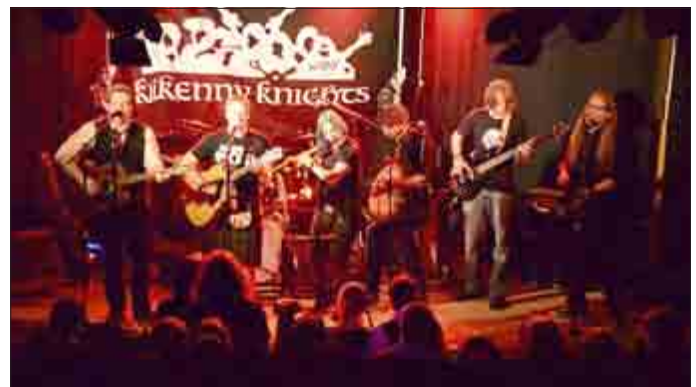
Kilkeny Knights.

Freitag, 19. Februar 2016, 20.00 Uhr Ratskeller