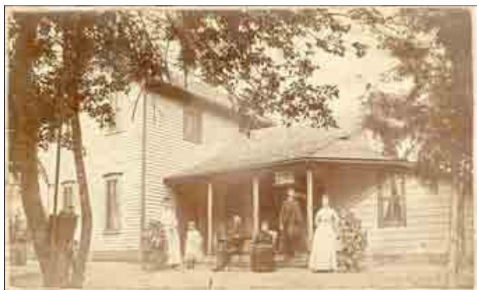
Stolz präsentiert sich eine hiesige Auswandererfamilie vor ihrer Farm in St. James (Nebraska).

Einen interessanten Vortrag bietet der „Verein für Heimatgeschichte Pöbneck e.V.“ Ende Januar lokalgeschichtlich interessierten Gästen an. Dass im 19. Jahrhundert mehrere Millionen Deutsche ihr Heimatland verließen und die große Reise nach Amerika antraten, ist landläufig bekannt. Nach Umfragen geben heute etwa 50 Millionen Amerikaner an, deutsche Wurzeln zu haben. Sind darunter auch solche aus Pöbneck und unserer näheren Umgebung? Gelegentlich fragen Amerikaner auch hier zu ihren Vorfahren nach. Bisher gab es zu den Auswanderungen aus unserem Gebiet praktisch keine Veröffentlichungen.