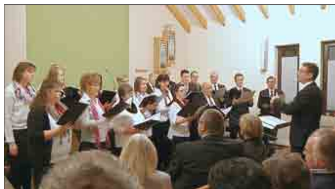
Vortrag des Gemeindechores

„Wann ist denn dieses Jahr euer Konzert?“ - so erkundigte sich mancher Anwohner aus Ranis, Rockendorf und Umgebung. Das Adventskonzert der Neuapostolischen Kirche Rockendorf gehört schon zu einer feststehenden Größe in der Region.