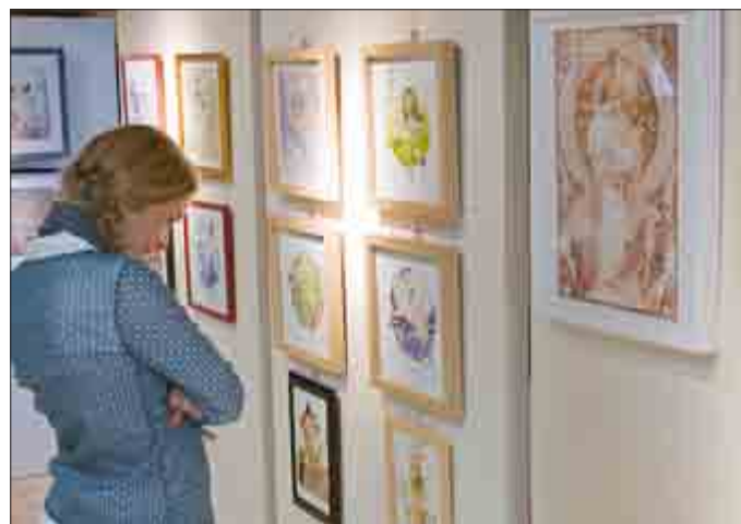
Eine Besucherin betrachtet Märchenwesen.