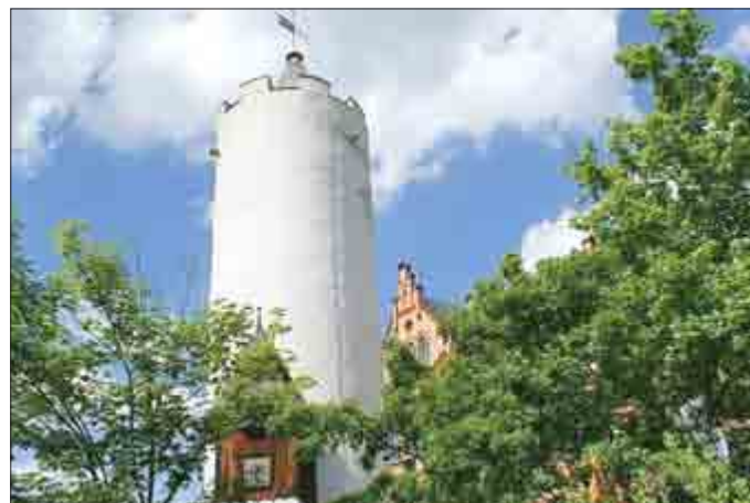
„Weißer Turm“ Pößneck (Foto: Stadtverwaltung Pößneck).

In der allgemeinen Stadtführung enthalten ist die Besichtigung des Weißen Turmes . Den Turm können Sie ebenso individuell besteigen. Seit 1994 hat diese Sehenswürdigkeit eine Wendeltreppe und ist mit 125 Stufen für alle interessierten Bürger und Gäste begehbar.