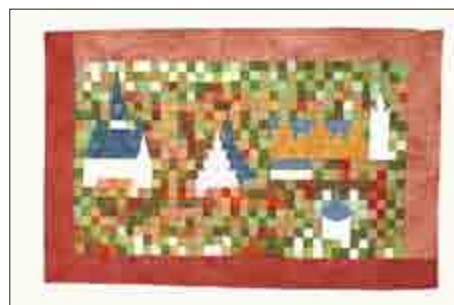
Die Stadtansicht Pößnecks als Patchwork-Motiv.

Kunstvoll arrangierte großflächige Arbeiten, mit teils detailgetreuer Wiedergabe von Motiven, aber auch abstrakter Umsetzung von Themen zeigt die Pößneckerin Ingvelde Schmidt in ihrer Werkschau zur Adventszeit im Museum642. Weihnachtliche Arrangements und Taschen in unterschiedlichen Formen komplettieren diese Ausstellung. Von wegen biedere Steppdecken im Stile der braven Amish-People – die Sonderausstellung im Museum642 zeigt vielmehr die spannende Entwicklung dieser handwerklich anspruchsvollen Kunst.