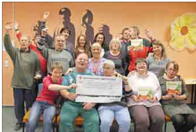
Freude über die Spende im MGH FZZ Pößneck

Vielleicht werden auch einige Rezepte aus unserem Buch ausprobiert und sorgen so für mehr Energie“, sagt Corinna Beck.