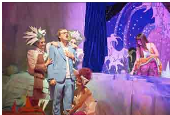
Szenenausschnitt „Die Zauberflöte“

Wolfgang Amadeus Mozart Deutsche Oper in zwei Aufzügen