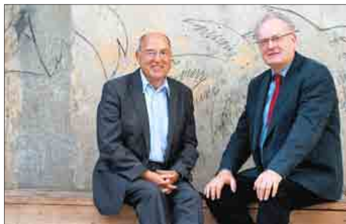
Gregor Gysi und Friedrich Schorlemmer

Vor der Wende standen Gregor Gysi und Friedrich Schorlemmer auf verschiedenen Seiten. Heute erinnern sie sich auf sehr persönliche Weise an ein verschwundenes Land und daran, wie sie es erlebten.