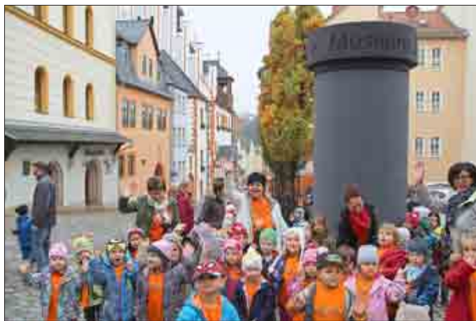
Kinder aus den Pößnecker Kindertagesstätten, hier Kita Wirbelwind, waren bei der Einweihung dabei.

In Pößneck gibt es nun wieder eine Litfaßsäule. Sie ist Bestandteil des Außenbereiches um das Museum642 und erinnert an den DEFA-Film „Moritz in der Litfaßsäule“, der 1983 in Pößneck gedreht wurde. Sie soll in Zukunft dazu dienen, Veranstaltungen zu bewerben, für die in der Pößnecker Stadtinformation Karten erhältlich sind. Außerdem wird die Litfaßsäule künftig Treffpunkt für Gruppen sein, die Stadtführungen durch Pößneck unternehmen wollen.