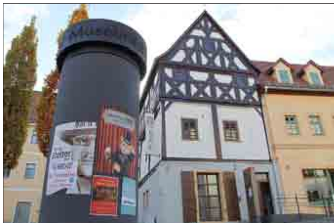
Die neue Litfaßsäule hat ihren Platz auf dem Klosterplatz und ziert den Eingangsbereich von Stadtinformation und Museum642 (Foto: Stadtverwaltung Pöbneck).

Die Litfaßsäule ist zurück in Pöbneck! Seit wenigen Tagen steht ein solches Exemplar auf dem Klosterplatz und grenzt unmittelbar an das Museum642 mit der Stadtinformation an. Damit soll an den DEFA-Film „Moritz in der Litfaßsäule“, der 1983 in Pöbneck gedreht wurde, erinnert werden. Informationen über diesen noch heute beliebten Film gibt es im Museum642 und die DVD ist in der Stadtinformation erhältlich.