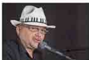
Thomas Stelzer

★ 9. Dezember: Vorweihnachtliches Rathauskonzert