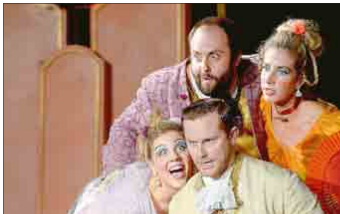
Szenenausschnitt aus „LA CENERENTOLA“.

Melodrama giocoso in zwei Akten von Gioachino Rossini / Libretto von Jacopo Ferretti Kooperation mit dem Lyric Opera Studio Weimar