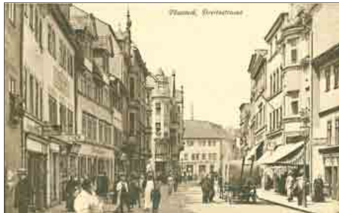
Die Breite Straße 1914

Das Anwesen besteht aus drei Häusern mit drei unterschiedlichen Erbauungszeiten. Erfahren Sie zum Denkmaltag mehr über dieses besondere Gebäude, das im Portalgewände die Schriftzeile „DER HER BEWARE DEINEN EINGANG UND AUSGANG BIS IN EWIGKEIT. AWE.“ trägt.