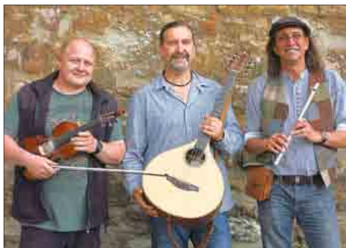
An Beal Bocht

AN BEAL BOCHT ist ein Irish-Folk-Trio, das über drei Stunden lang mit Songs, Jigs, Reels und Balladen den Saal in ein wogendes Meer verwandelt und eine Stimmung entstehen lässt, wie man sie sonst höchstens noch bei urig-deftigen Sessions in Irland erlebt.