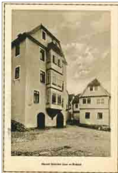
Das ehemals Fischersche Haus am Kirchplatz