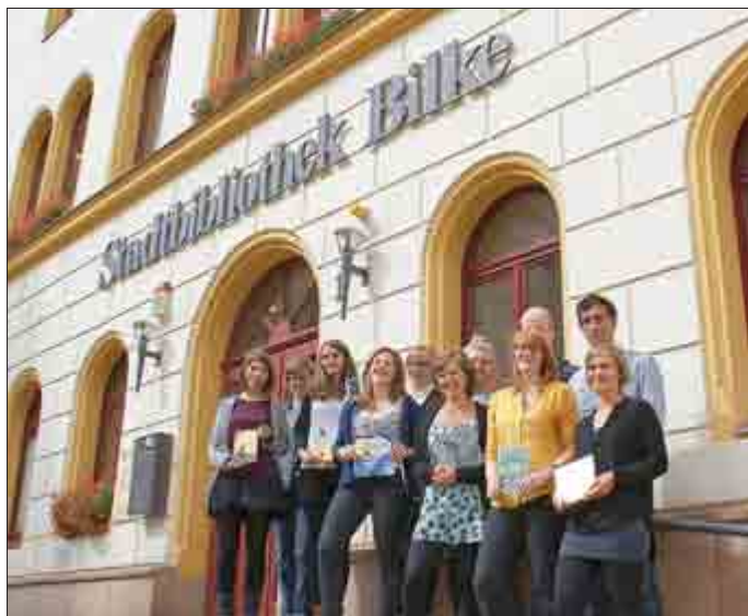
Studenten der Uni Erfurt mit ihren Werken