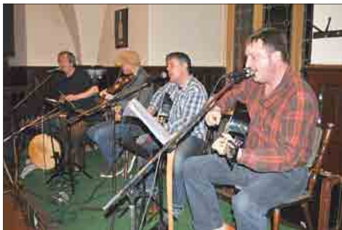
The PUBLINERS

Zu Gast sein werden die legendären PUBLINERS , die Titanen des Irish Folk, wie sie in ihrer Heimat, dem Jenaer Irish Pub „Fiddlers Green“ genannt werden. Das Publikum darf sich auf immense Spielfreude und viele altbekannte Klassiker des Irish Folk zum Mitsingen und -tanzen freuen.